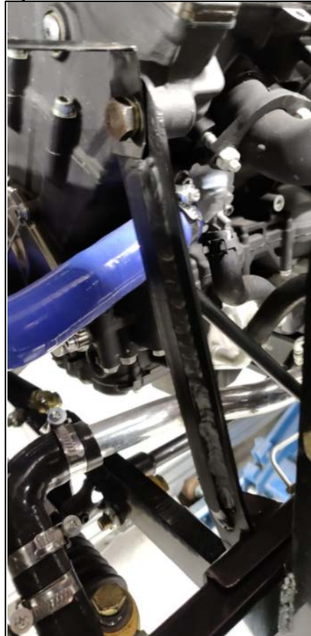
Kuva-B1, Vasen puoli -vahvistushitsattu koko pituudeltaan