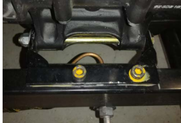
Kuva-A1 ja A2, Oikea puoli